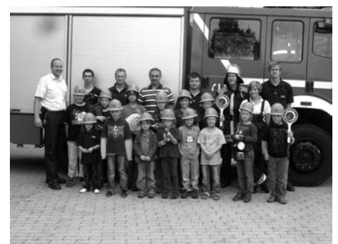
Erlebnisstunden bei der Freiwilligen Feuerwehr Altenkunstadt