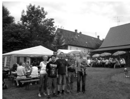
Sommerfest des Obst- und Gartenbauvereins Strössendorf