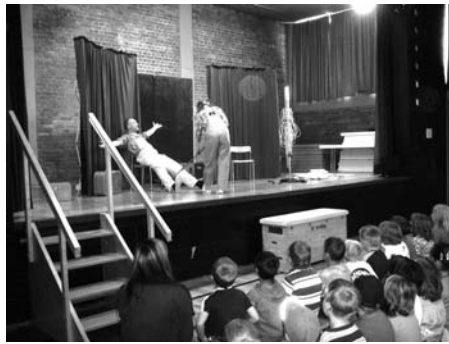
Der Kulturverein Altenkunstadt präsentiert „Max und Moritz“ mit dem Fränkischen Theatersommer – Landesbühne Oberfranken in der Grundschulturnhalle Altenkunstadt