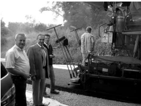
Gemeindeverbindungsstraße Strössendorf - Weidnitz mit Geh- und Radweg