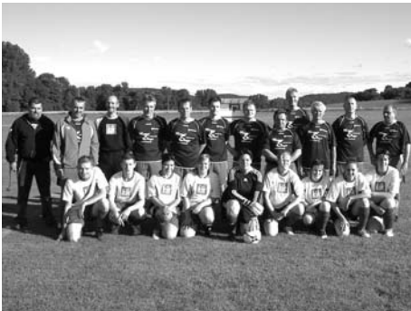
Kirchweihfußballspiel in Woffendorf